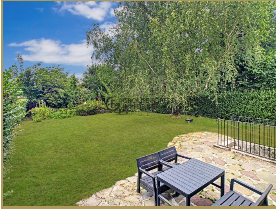
JARDIN CLOS PAYSAGER